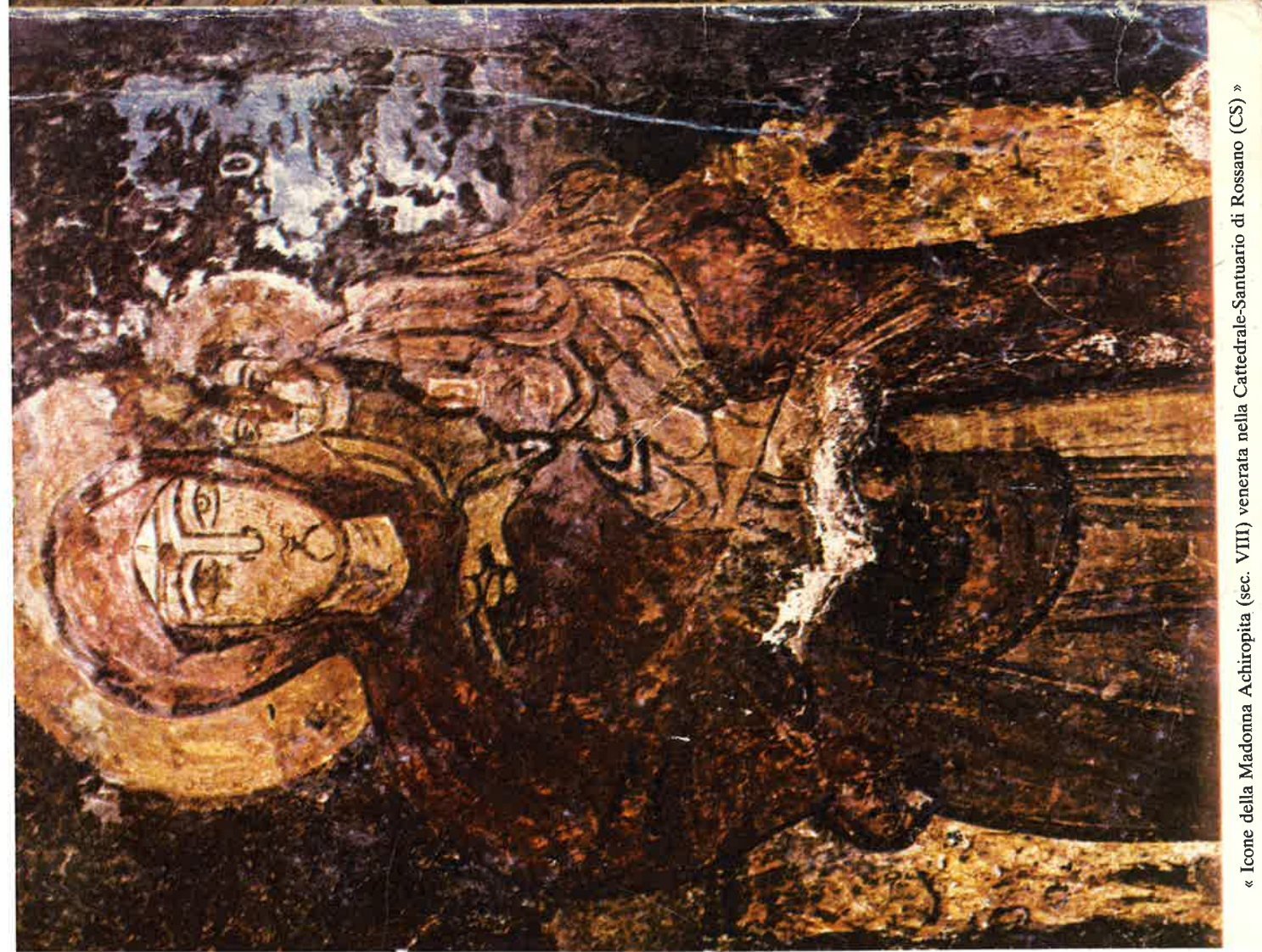
« Icone della Madonna Achiroplita (sec. VIII) venerata nella Cattedrale-Santuario di Rossano (CS) »