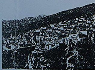
ROSSANO - Panorama